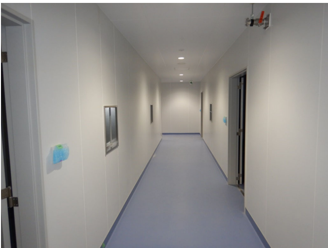
内装工事施工状況（2/24撮影）