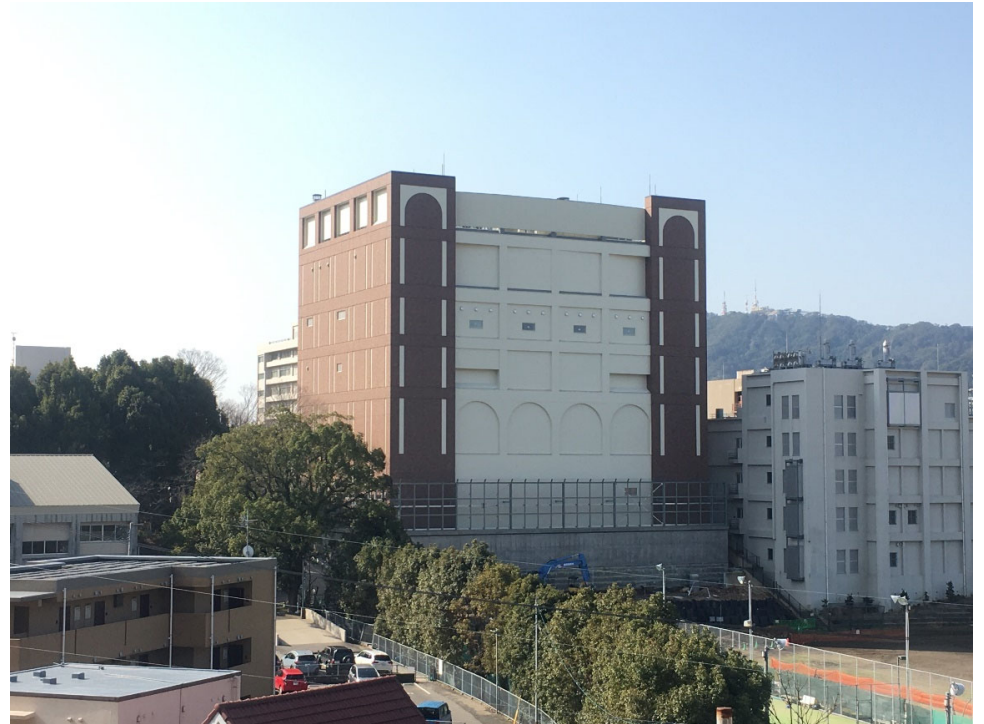
施工状況全景（2/25撮影）