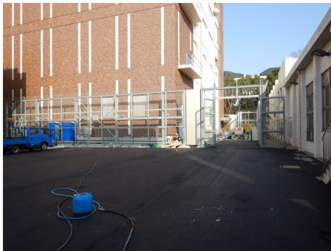
外構工事施工状況（2/24撮影）