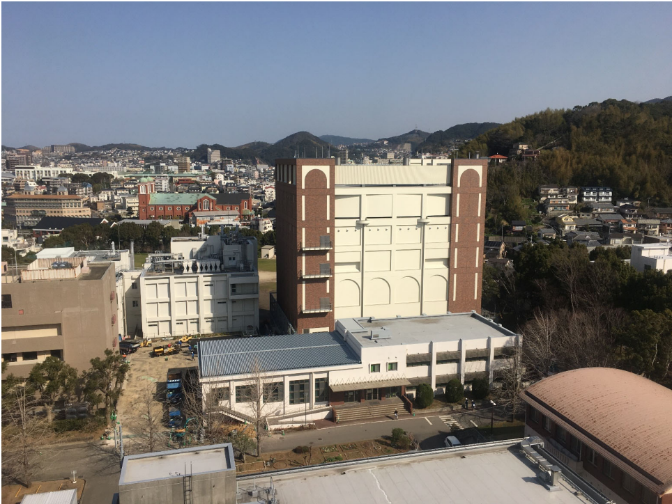
施工状況全景（2/25撮影）