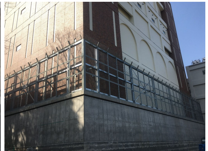
外構工事施工状況（2/25撮影）