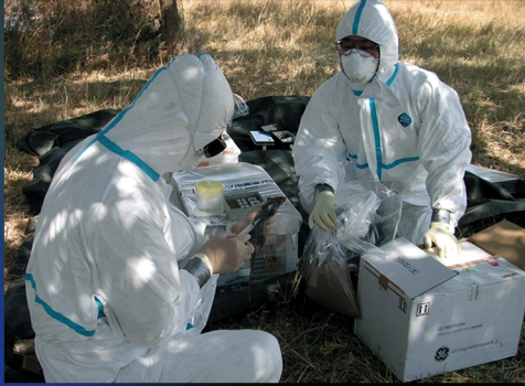
野ネズミから採血