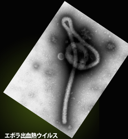
エボラ出血熱ウイルス

近年、新しい感染症が次々と世界中で発生している。そのほとんどが、人にも動物にも感染する微生物によっておこる。「人獣共通感染症」である。その中から、インフルエンザウイルスとエボラ出血熱ウイルスについて、ウイルスの存続様式と進化について考えてみたい。