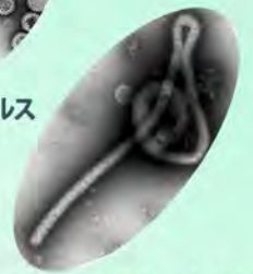
エボラ出血熱ウイルス

平成23年1月26日(水) 午後7時00分～午後8時30分 長崎市立図書館 新興善メモリアルホール (〒850-0032 長崎市興善町1-1)