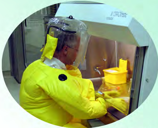
BSL-4施設での研究の様子