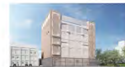
2021年7月竣工予定のBSL-4施設

A 現在、色々なリスク管理について、具体的に一つ一つご紹介しているところです。次回以降は実験者や廃棄物に関する管理運営方法等をご説明いたしますので、ご意見をいただければと思っています。なお来年夏の施設の竣工後すぐに実験を始めるわけではなく、機材の搬入等を数カ月かけて行い、その後、作成した規則の原案で運用ができるかどうかを、実際の施設を使用して確認する予定です。したがって、規則のあらましは来年の竣工までに作成し、その後応分の年月を要してきちんと運営できるか確認を行い完成させたいと考えています。