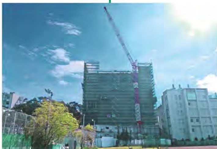
2020年10月 屋上階 鉄筋・型枠工事