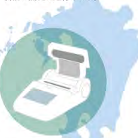
蛍光LAMP法検査システム

A キヤノンメディカルと共同開発した蛍光LAMP法検査システムが県内15の医療機関と検査場に重点的に配備されました。福岡県や空港、スポーツのイベント等でも使用されていく予定です。 ※現在、より多くの検体処理が可能な機器の開発も進行中です。