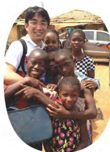
ギニア共和国にて 現地の子どもたちと

現在、長崎大学はエボラウイルスなども扱える最高レベルの安全性を備えたBSL-4施設と呼ばれる新たな感染症研究施設を建設しています。