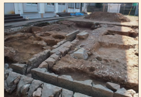
長崎市立佐古小学校（長崎市西小島1丁目）の工事中に発掘された養生所の遺構。

1861年にポンペが創立した養生所。貧しい人々を無料で診療し、侍や町人、日本人や外国人の区別を一切しなかったといえます。