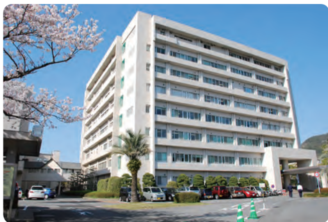
2017年に創立160周年を迎える長崎大学医学部

長崎県は、人口に対する感染症の専門医の数の比率が全国でトップですが、これは長崎大学が感染症を得意としてきたからにほかなりません。たとえば、第二内科で感染症を学び、その後、全国各地の大学病院で感染症領域の教授に就任した人材は30人を超えています。感染制御教育センターでは、院内感染対策に積極的に取り組むだけでなく、地域全体の感染症情報を集め、感染症の